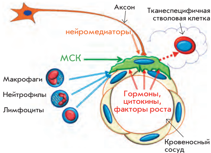
Рис. 3. Схема взаимодействия МСК с аксонами, эндотелиальными клетками, лейкоцитами и тканеспецифичными стволовыми клетками (см. пояснения в тексте).

кишечнике и коже также обнаружены популяции МСК, ответственных за регуляцию трофики и восстановления этих тканей при повреждении. Однако насколько важно их взаимодействие с тканеспецифичными стволовыми клетками для процессов обновления тканей еще предстоит выяснить. По крайней мере в костном мозге МСК – это необходимый компонент периваскулярной ниши тканеспецифичных