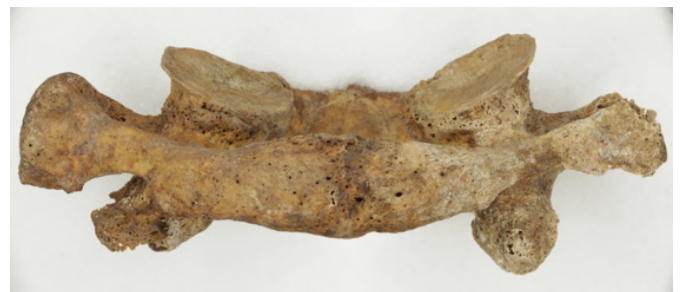
Рис. 1. Останки из разрушенного саркофага Спасо-Преображенского собора Переславля. Первый шейный позвонок, вид сзади. Хорошо заметен различный наклон отмеченных стрелками поверхностей

В 2014 г. в связи с планируемыми реставрационными работами в Спасо-Преображенском соборе и рядом с ним была заложена серия шурфов и открыт ранее не документированный и закрытый деревянной пробкой шурф в юго-восточном углу собора. В шурфе обнаружены остатки белокаменного саркофага в виде четырехугольного ящика, немного расширяющегося к западу, неглубокого, с фрагментами разбитой крышки. Саркофаг был помещен вдоль стены храма. Сохранился ЮЗ угол (изголовье), частично южная стенка и частично дно саркофага. Длина саркофага 165 см, ширина 60 см, толщина боковой стенки 5 см, высота 32 см. Около саркофага, в заполнении, были обнаружены разрозненные человеческие кости. Целая серия костей