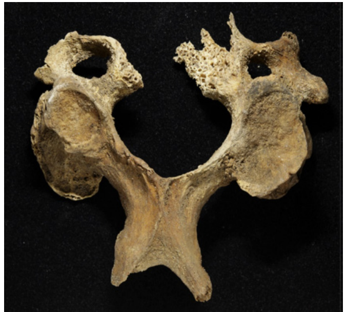
Рис. 2. Останки из разрушенного саркофага Спасо-Преображенского собора Переславля. Деформация сочленованных поверхностей третьего шейного позвонка

Состояние суставных поверхностей мелких суставов кисти и стопы, наличие остеофитов и артрозов на позвонках шейного и грудного отделов. Значительный функциональный рельеф на костях кисти, наличие локального участка «полировки» на первом шейном позвонке позволяют считать возраст человека зрелым. Отсутствие полного скелета затрудняет определение возраста. Вероятно, возможно использовать широкий возрастной интервал: 35–49 лет. Размерность костей кисти позволяет считать, что останки принадлежат мужчине. Отмечена асимметрия наклона правых и левых верхних и нижних суставных ямок первого позвонка (атланта), что позволяет предполагать, для индивида было типичным положение головы, чуть отведенной в левую сторону.