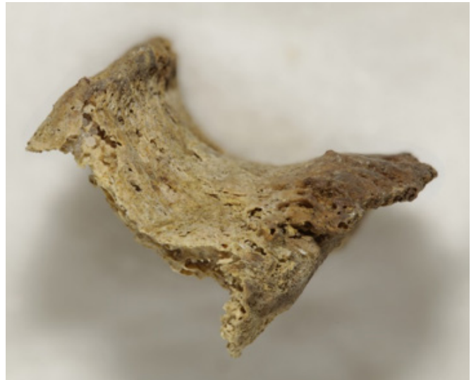
Рис. 3. Останки из разрушенного саркофага Спасо-Преображенского собора Переславля. Остеофит на фрагменте тела грудного позвонка