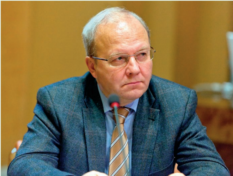
Академик Алексей Хохлов

ко с госучастием) сформировать планы своего инновационного развития. По всей вероятности, те платформы, которые войдут в федеральный перечень ТП, будут взаимосвязаны с этими планами.