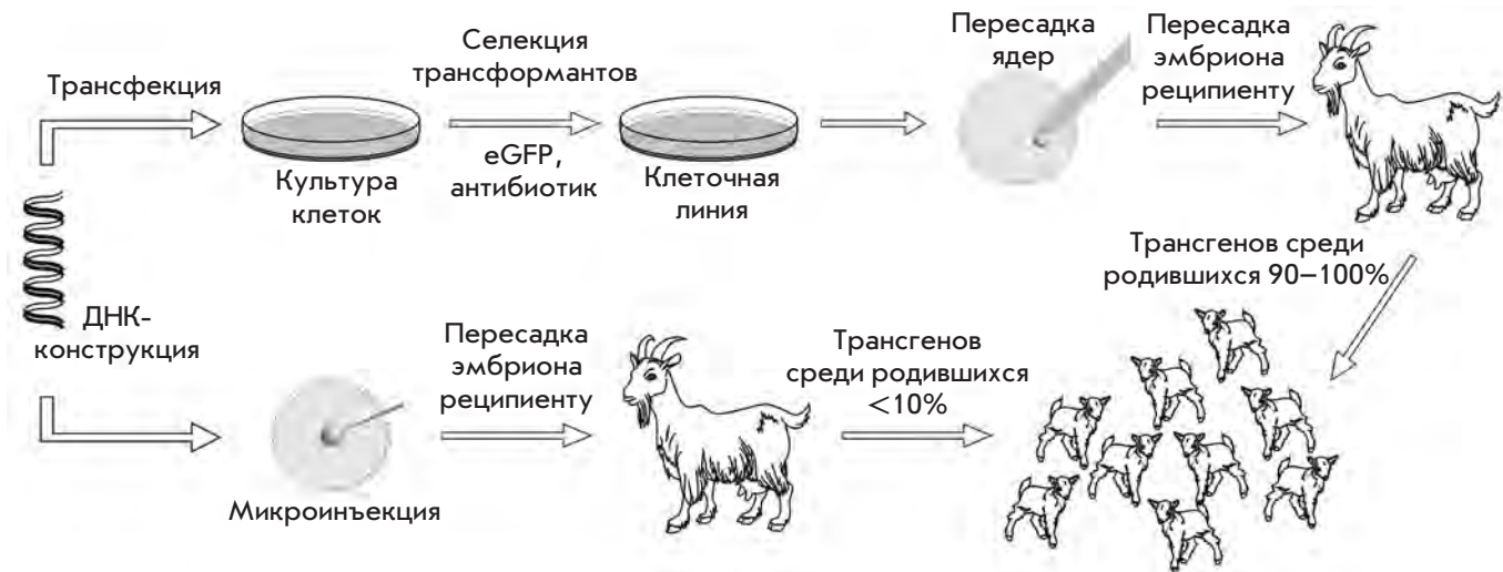
Рис. 1. Схема получения трансгенных животных методом переноса ядер (верхняя часть) и микроинъекции ДНК в ядро (нижняя часть)

пищевых продуктов и лекарственных препаратов США (FDA) в качестве препарата для предотвращения образования тромбов у пациентов с наследственным дефицитом антитромбина. В 2011 году ЕМЕА одобрило применение рекомбинантного С1-ингибитора эстеразы, произведенного в кроликах, при наследственном ангионевротическом отеке. Появление первых допущенных к медицинскому применению терапевтических препаратов, полученных с использованием ТЖ, дает основания предполагать, что в ближайшее время РБ займут значительную нишу в биотехнологии. Некоторые биотехнологические компании (PPL Therapeutics (Англия), GTC Biotherapeutics (США) (поглощена в 2010 году компанией LFB Biotechnologies, Франция), Hematech (США), Genzyme (США), ZymoGenetics (США), Nexia Biotechnologies (Канада), Pharming (Нидерланды), BioProtein Technologies (Франция), Avigenics (США), Viragen (США) и TranXenoGen (США)) активно работают над развитием этой технологии. В настоящем обзоре приведены общие представления о получении ТЖ для продукции РБ человека и мАТ.